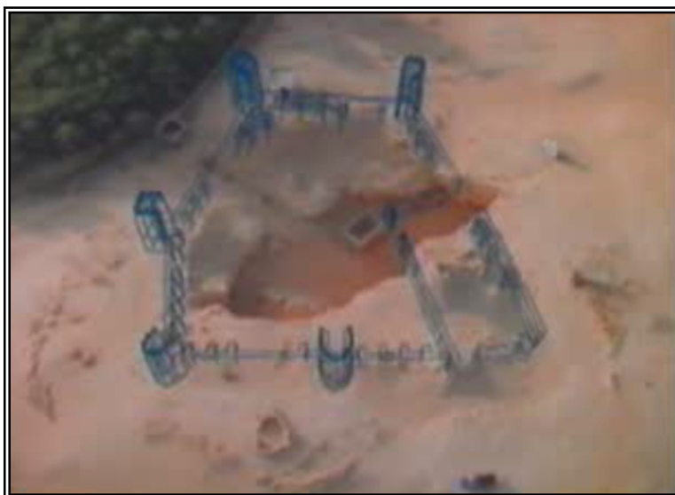
تصویر شماره ۳