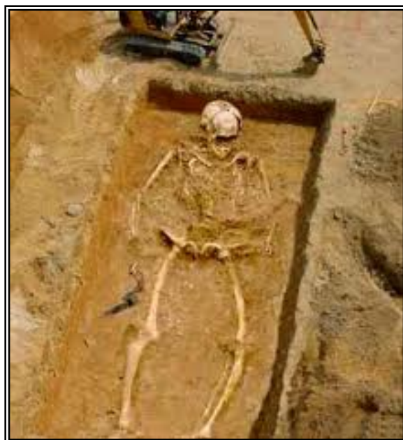
تصویر شماره ۶