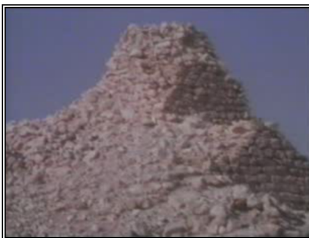
تصویر شماره ۴