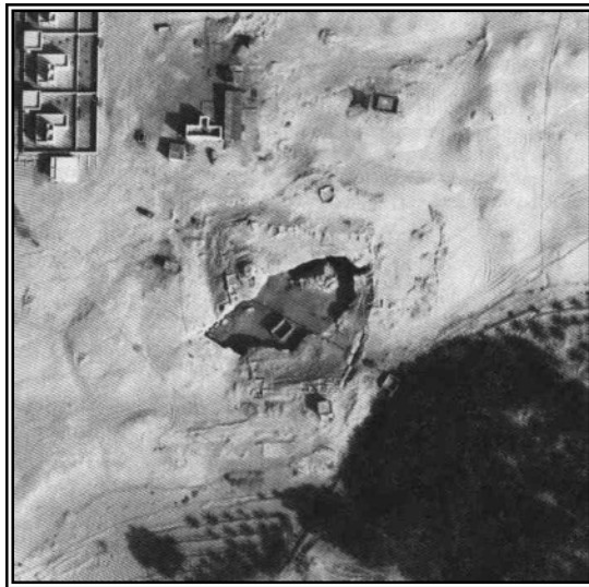
تصویر شماره ۲