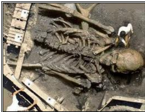
تصویر شماره ۵